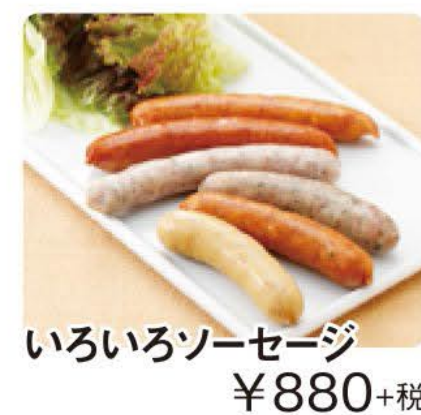
いろいろソーセージ ¥880+税