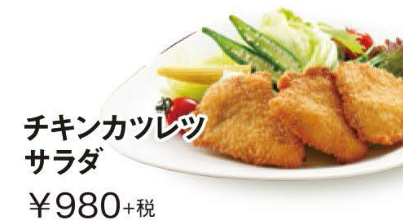
チキンカツレツサラダ ¥980+税