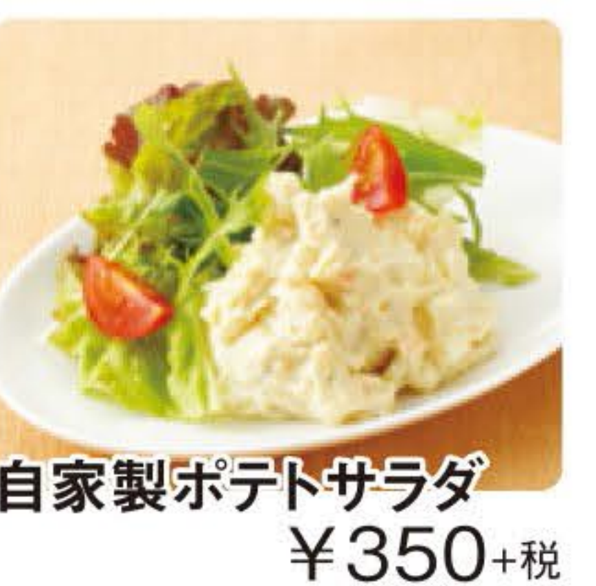
自家製ポテトサラダ ¥350+税