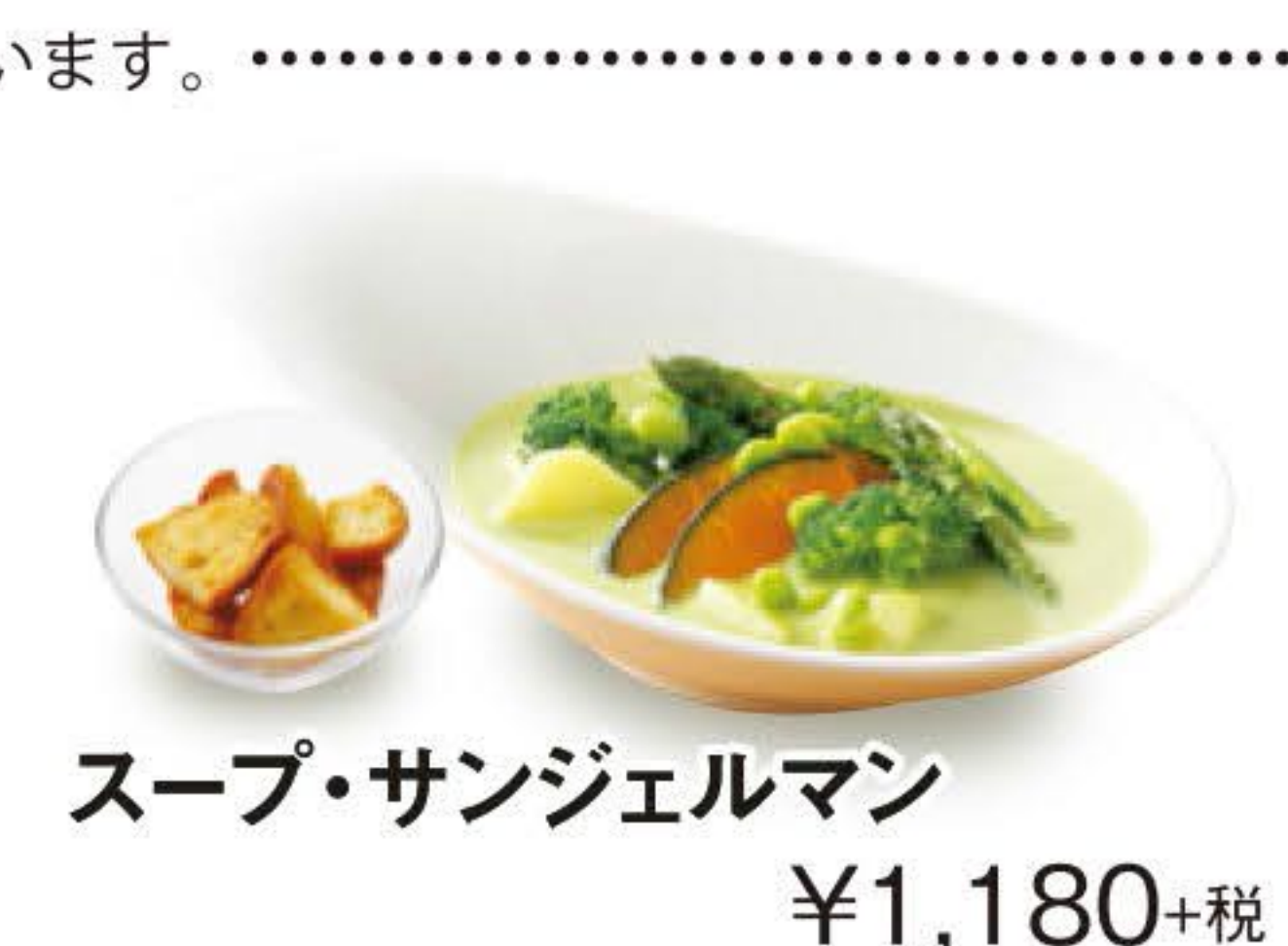
スープ・サンジェルマン ¥1,180+税