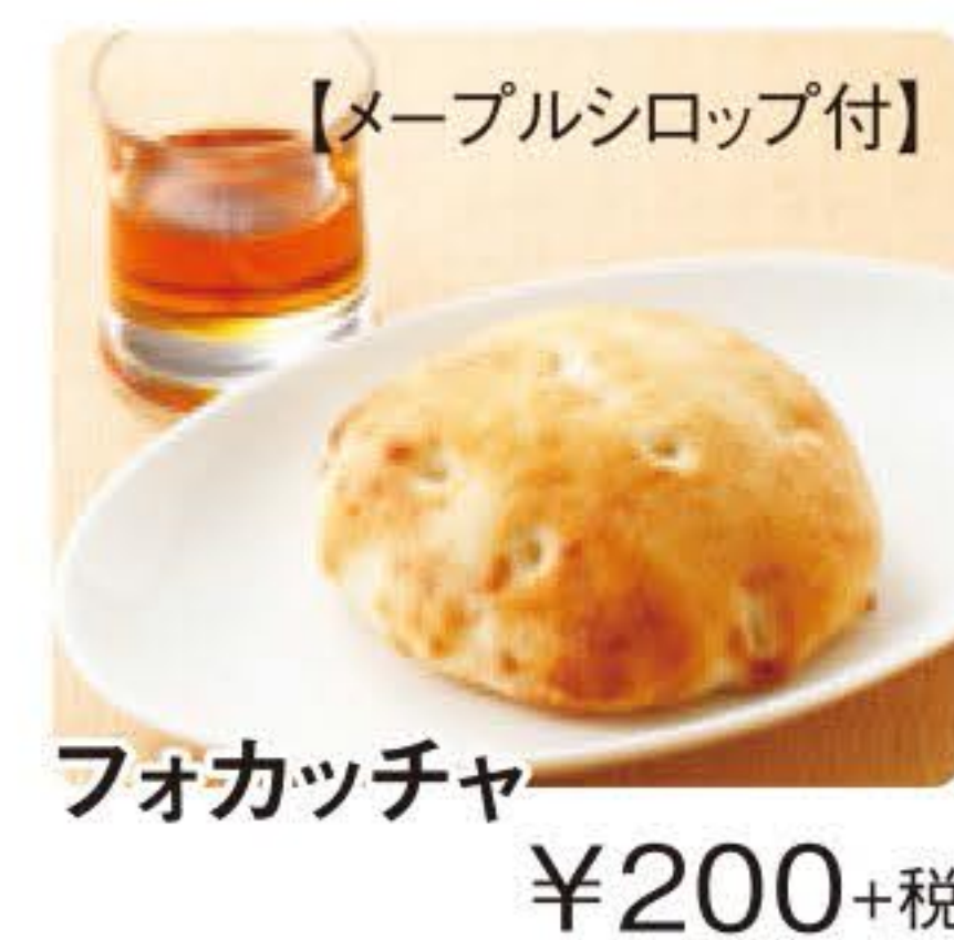
【メープルシロップ付】 フォカッチャ ¥200+税