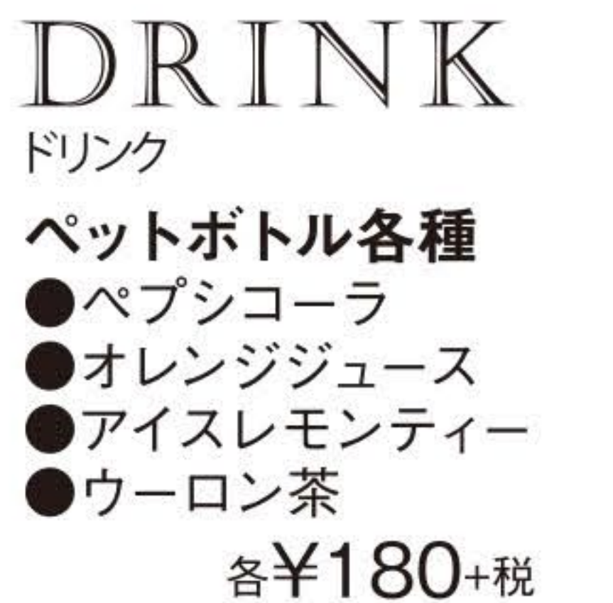
DRINK ドリンク ペットボトル各種 ●ペプシコーラ ●オレンジジュース ●アイスレモンティー ●ウーロン茶 各¥180+税