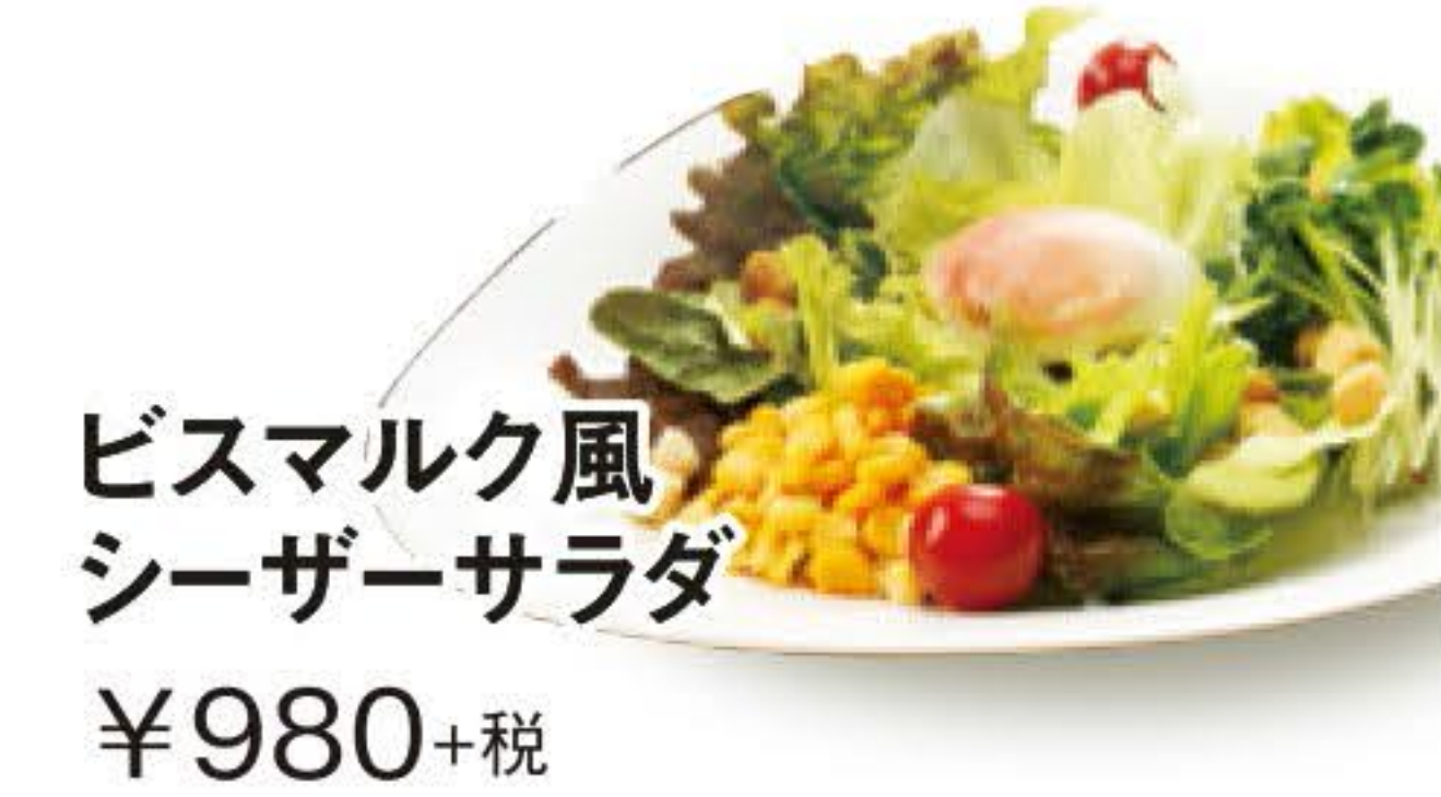
ビスマルク風シーザーサラダ ¥980+税