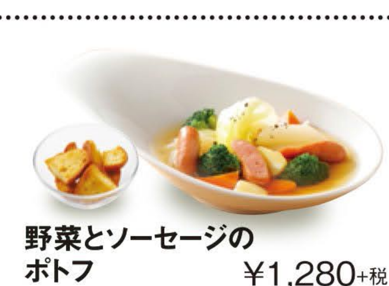
野菜とソーセージのポトフ ¥1,280+税