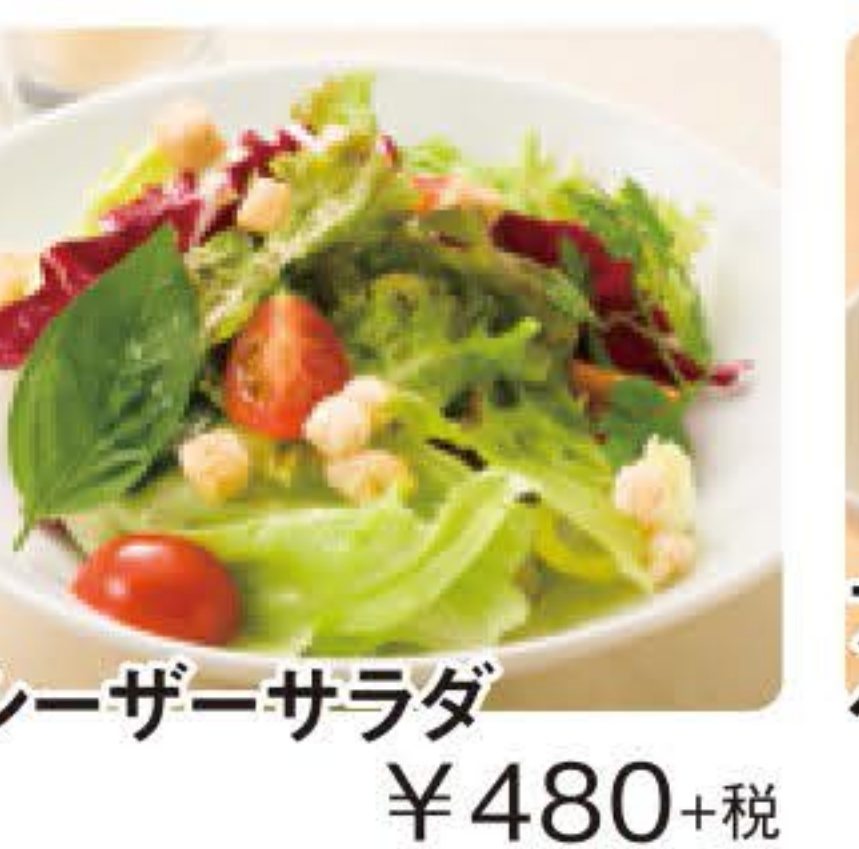
シーザーサラダ ¥480+税