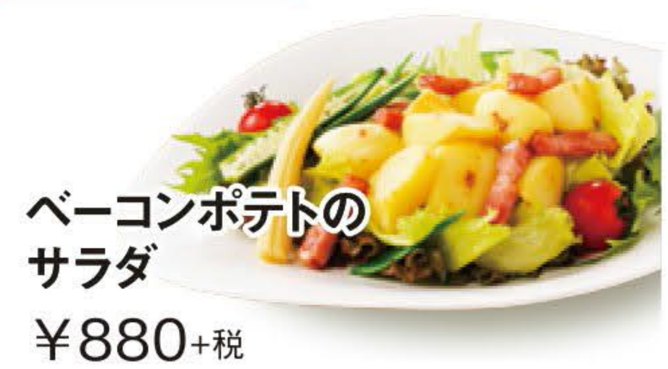
ベーコンポテトのサラダ ¥880+税