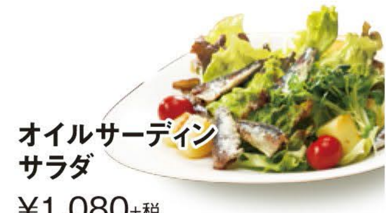
オイルサーディンサラダ ¥1,080+税