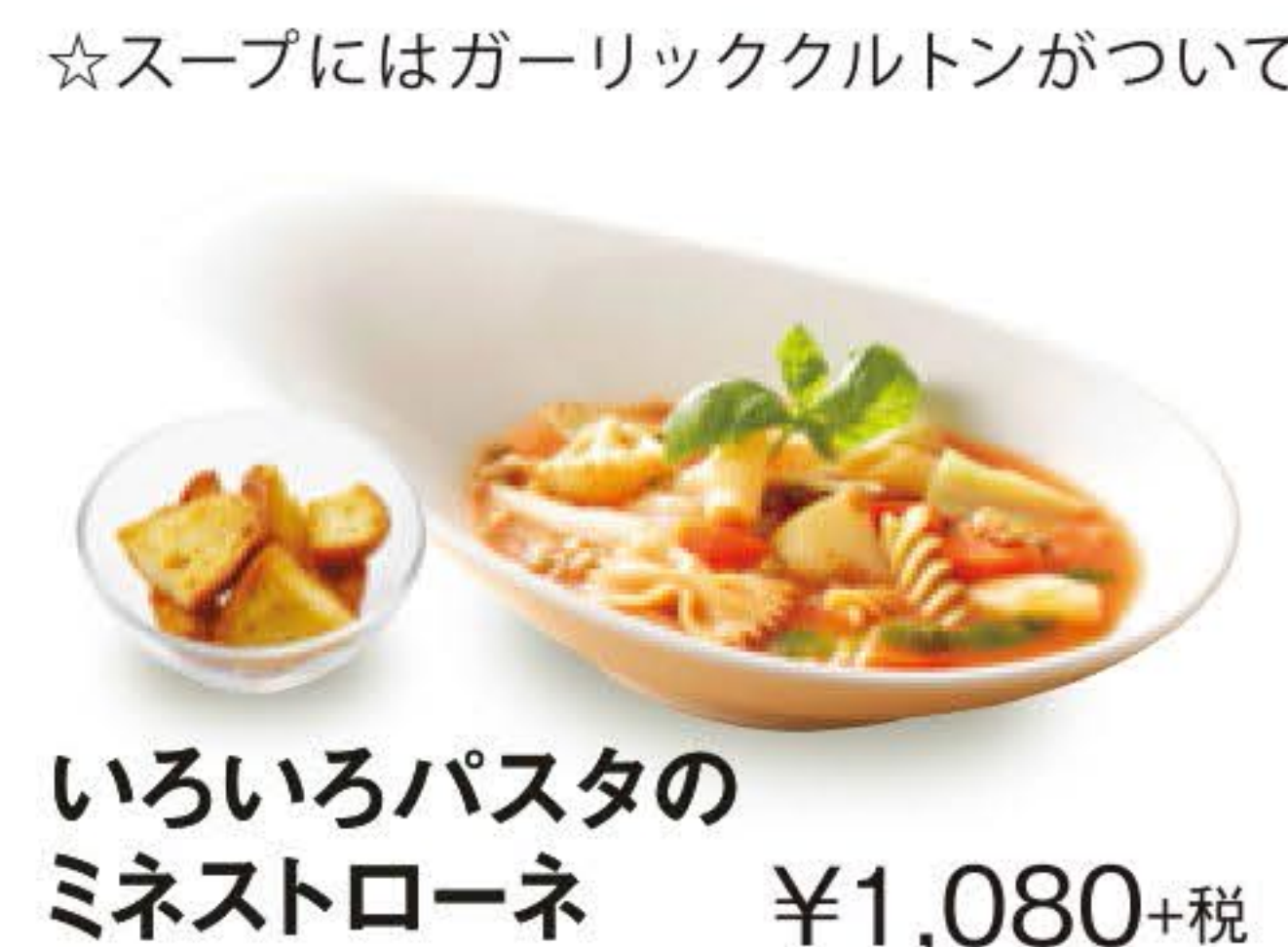
いろいろパスタのミネストローネ ¥1,080+税