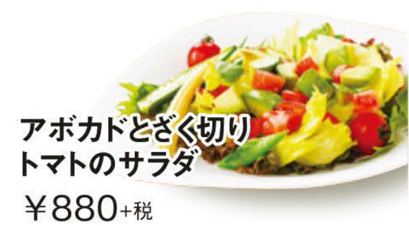
アボカドとざく切りトマトのサラダ ¥880+税