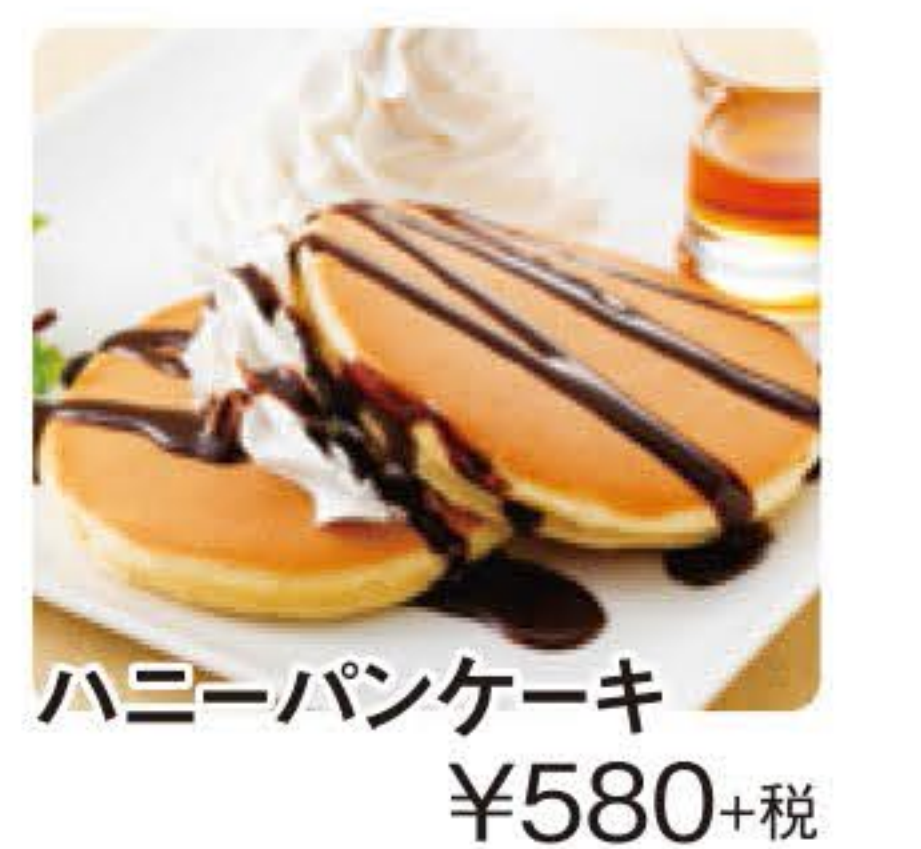
ハニーパンケーキ ¥580+税