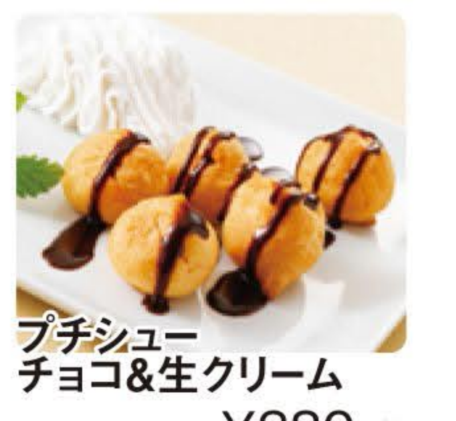
プーチューチョコ&生クリーム ¥380+税