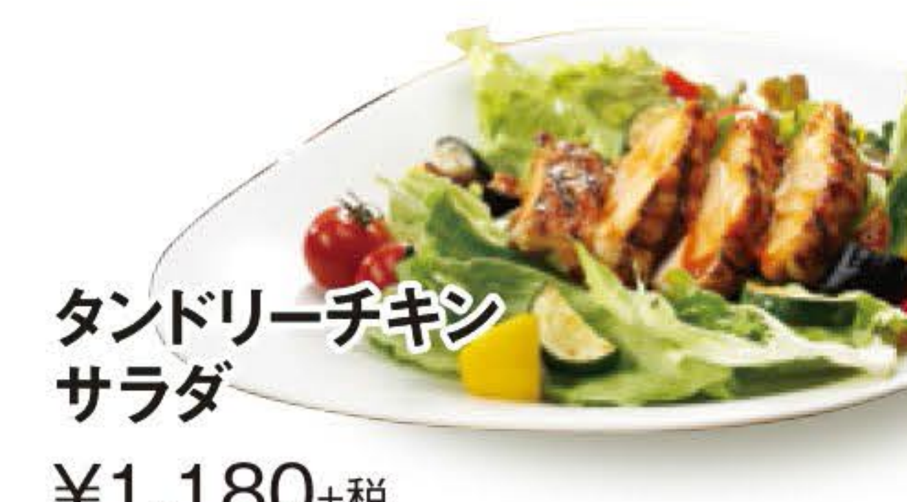
タンドリーチキンサラダ ¥1,180+税