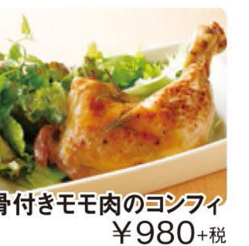
骨付きモモ肉のコンフィ ¥980+税