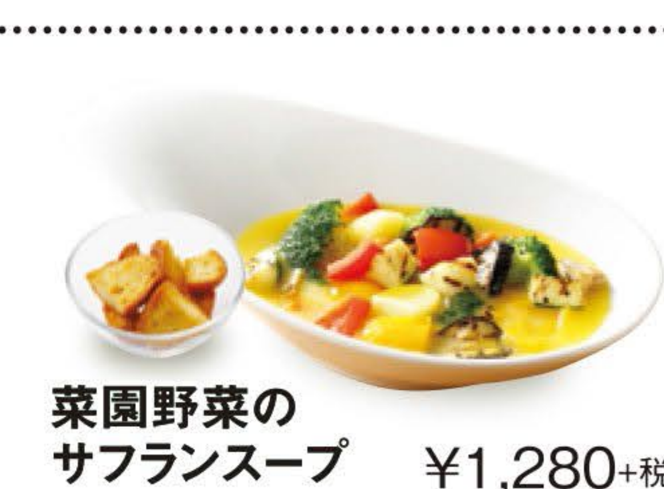
菜園野菜のサフランスープ ¥1,280+税