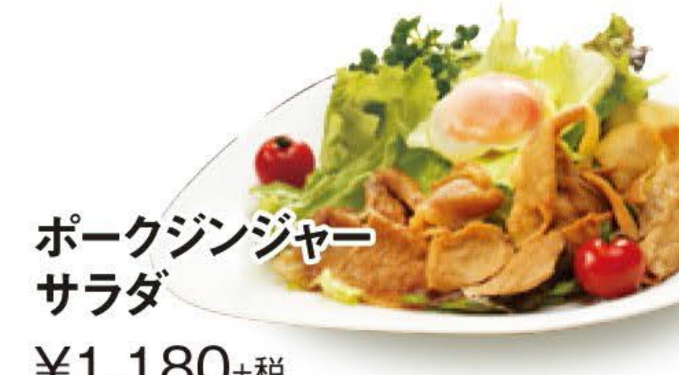
ポークジンジャーサラダ ¥1,180+税