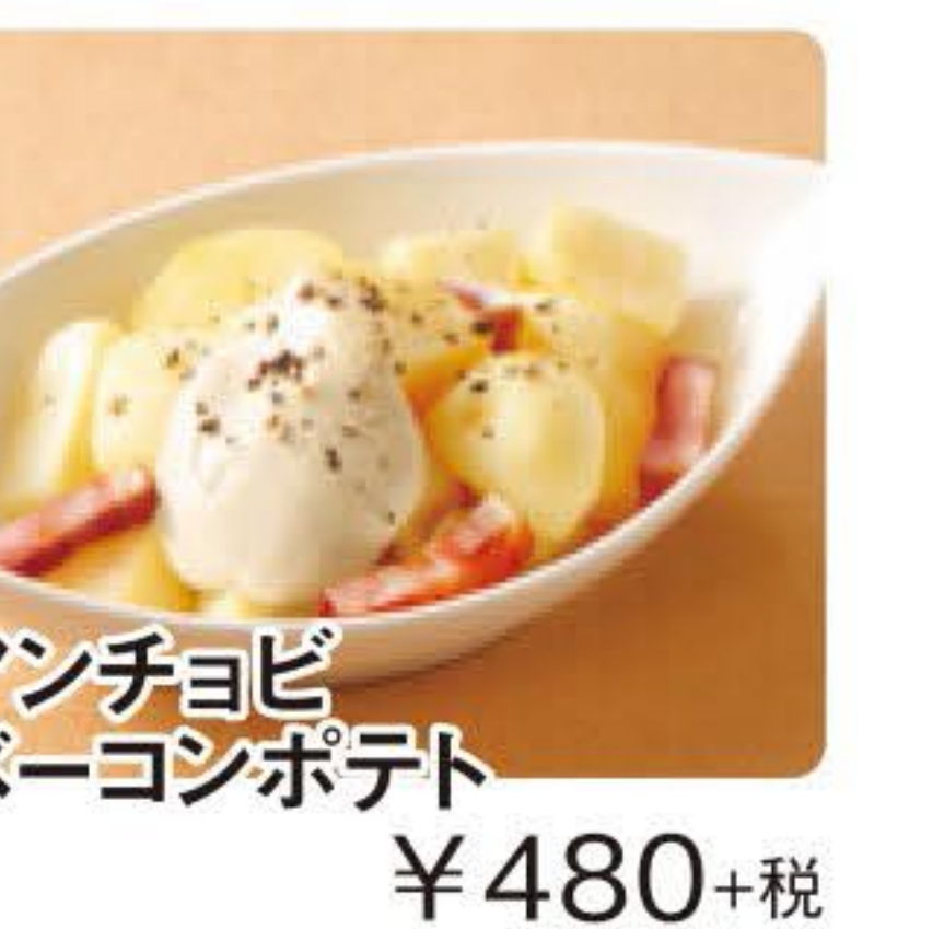
アンチョビベーコンポテト ¥480+税