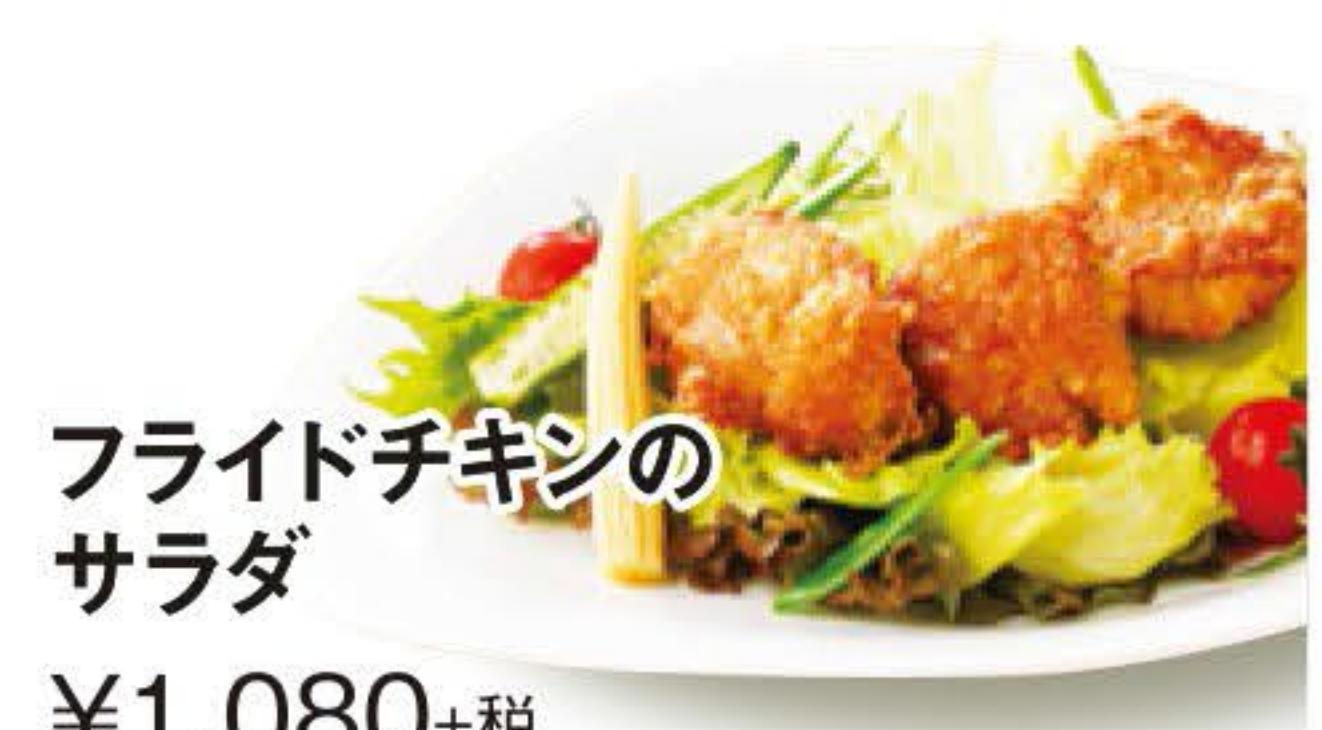
フライドチキンのサラダ ¥1,080+税