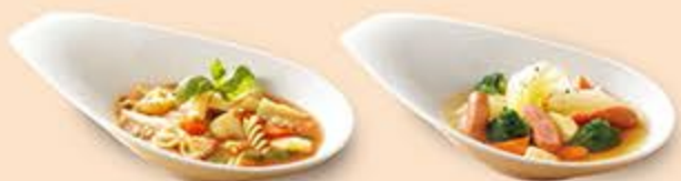
いろいろパスタのミネストローネ