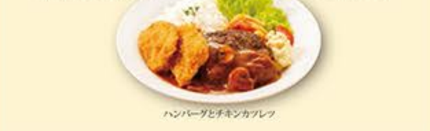
ハンバーグとチキンカツレツ