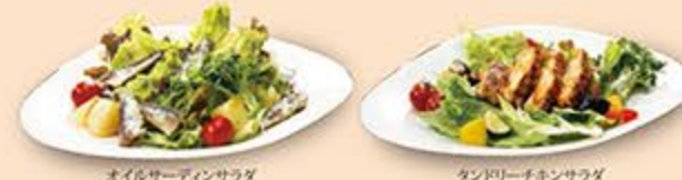
オイルサーディンサラダ