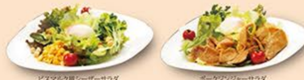
ビスマルク風シーザーサラダ