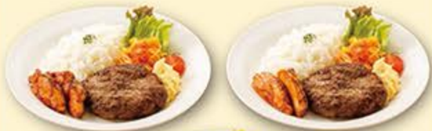
ハンバーグとタンドリーチキン