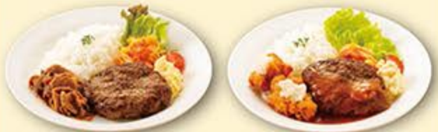
ハンバーグとポークジンジャー