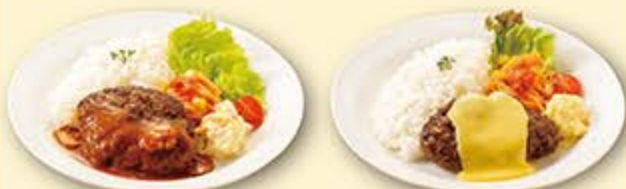
ハンバーグプレート