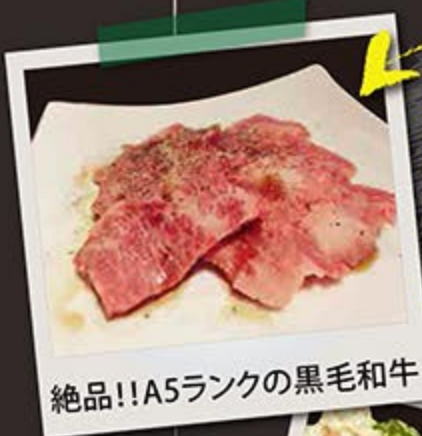
絶品!! A5ランクの黒毛和牛

本日のおすすめは 店内ボードで チェック〜♪ メニューにはない お肉が登場 したりしますよ〜☆