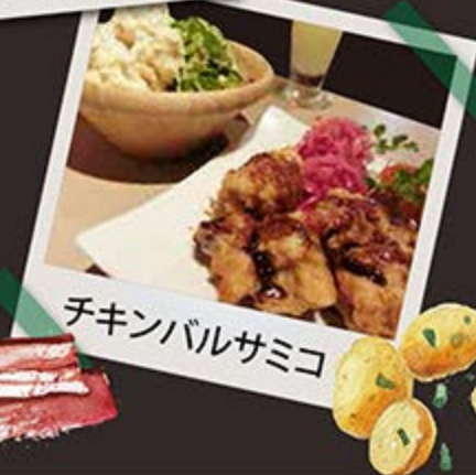
チキンバルサミコ

本日のおすすめは 店内ボードで チェック〜♪ メニューにはない お肉が登場 したりしますよ〜☆